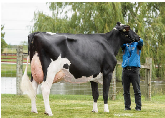
QUALITY SOLOMON LUSTFUL DAM

CROTEAU LESPERRON UNIX QUALITY SOLOMON LUSTFUL VG-88-3YR-CAN WALNUTLAWN SOLOMON BOSDALE GOLD LUSTER EX-94-5YR-CAN 6* BRAEDALE GOLDWYN BOSDALE DUNDEE LUSTRE EX-91-6YR-CAN 6*