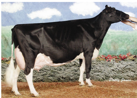
IDEE LUSTRE FIFTH DAM