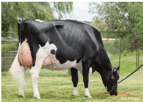
QUALITY SOLOMON LUSTFUL DAM